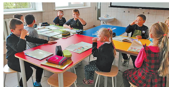
Dėmesys gamtamoksliniam ugdymui.

Gamtos mokslų laboratorijoje mokykla jau spėjo įvykdyti net 64 veiklas. Laboratorijoje vyksta pamokos, o po jų – būreliai „Mažoji laboratorija“, „STEAM-