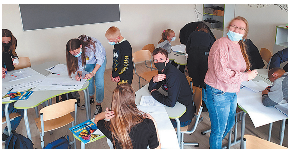
Naujos erdvės sustiprina norą mokytis.